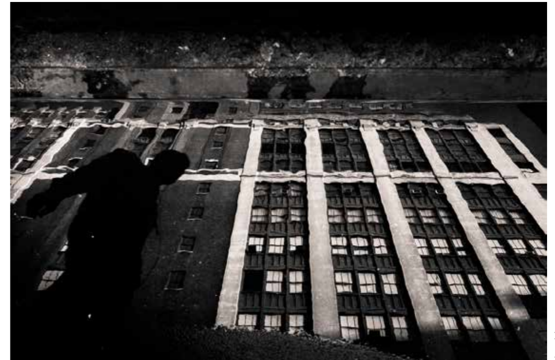
Lo Kee Window(s)