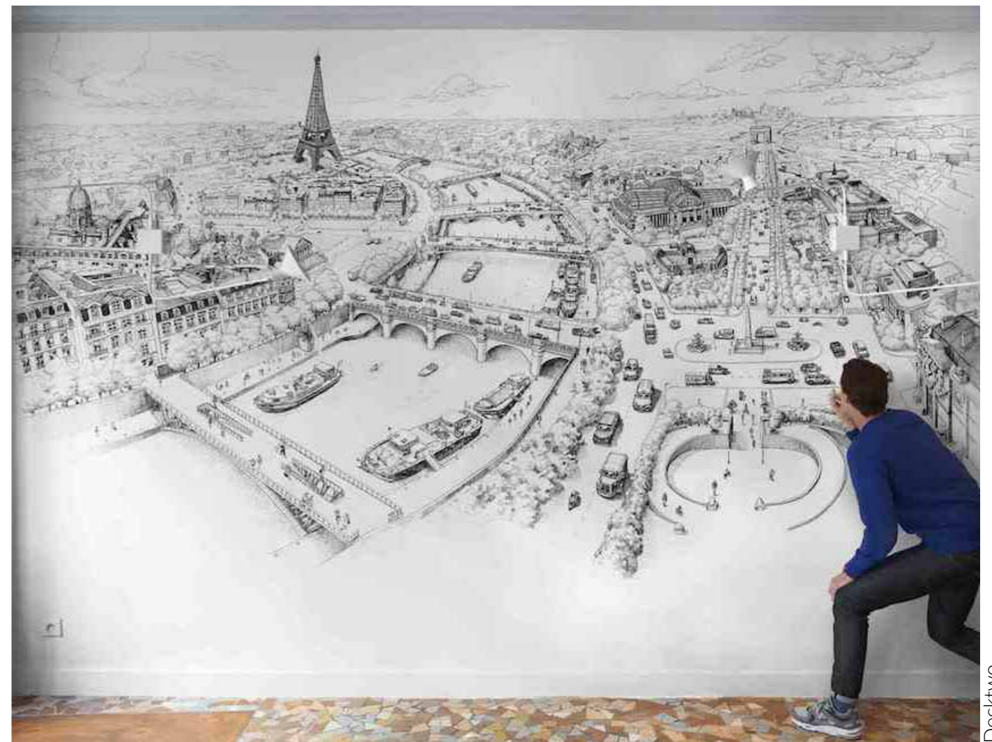
Decktwo Nous 4 Paris