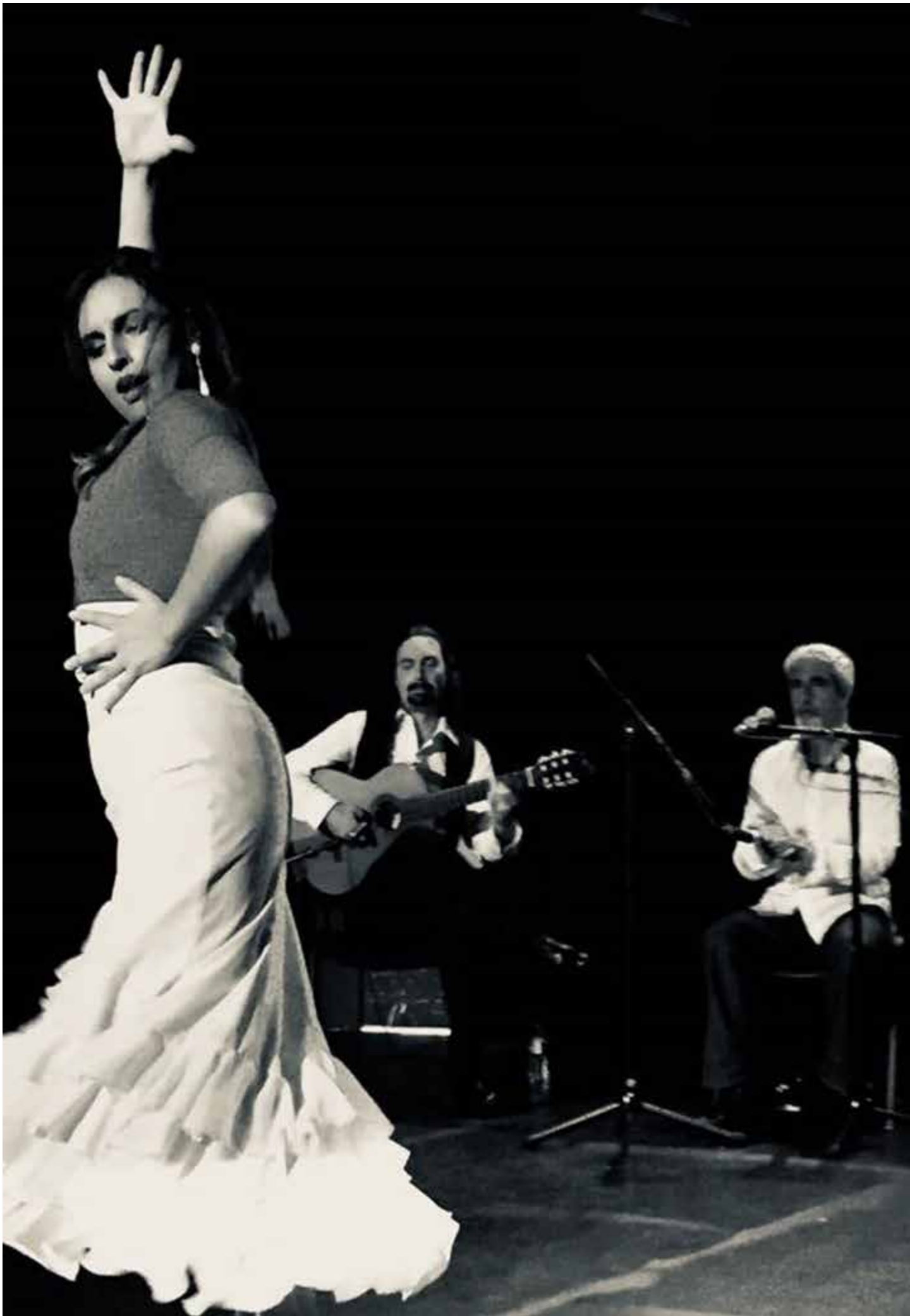
Flakete Flamenko Grand Concert Flamenco