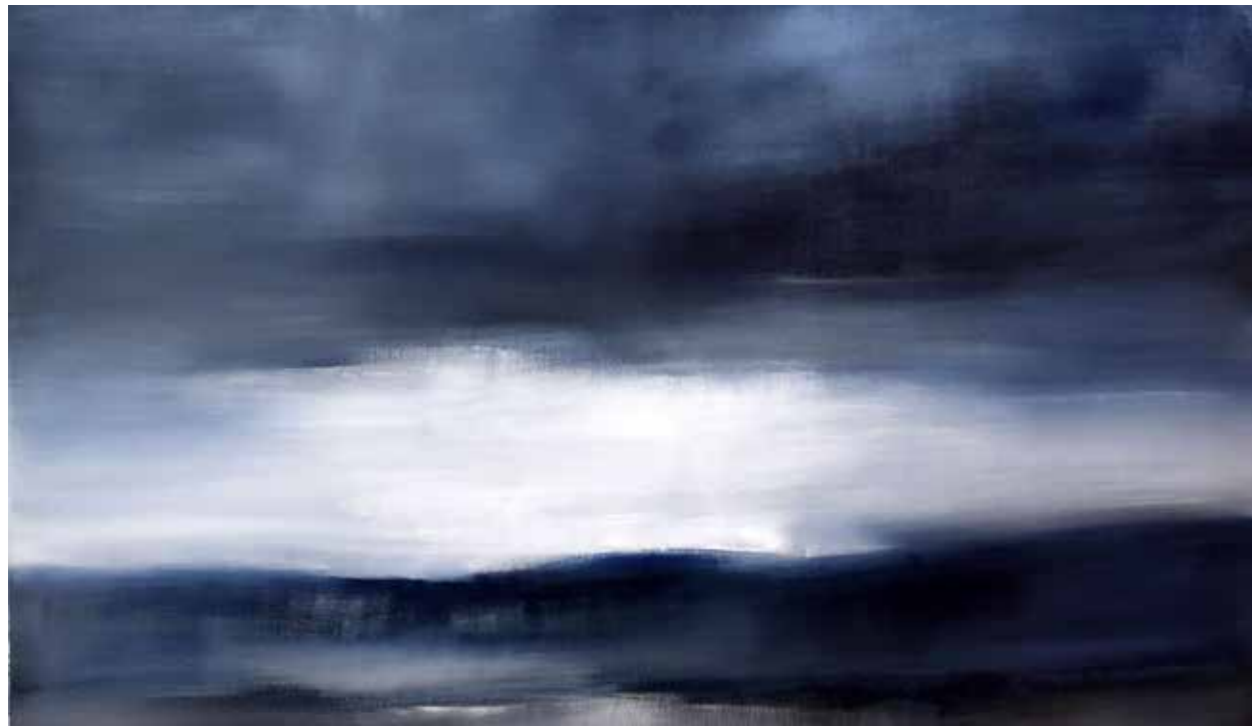
Pascale Benéteau Gros Grain